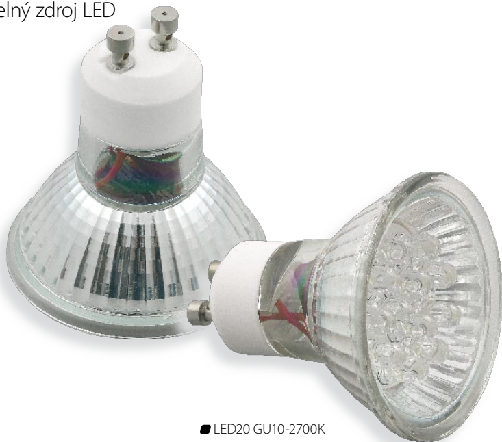
■ LED20 GU10-2700K